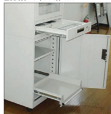
■使用例 Example of application